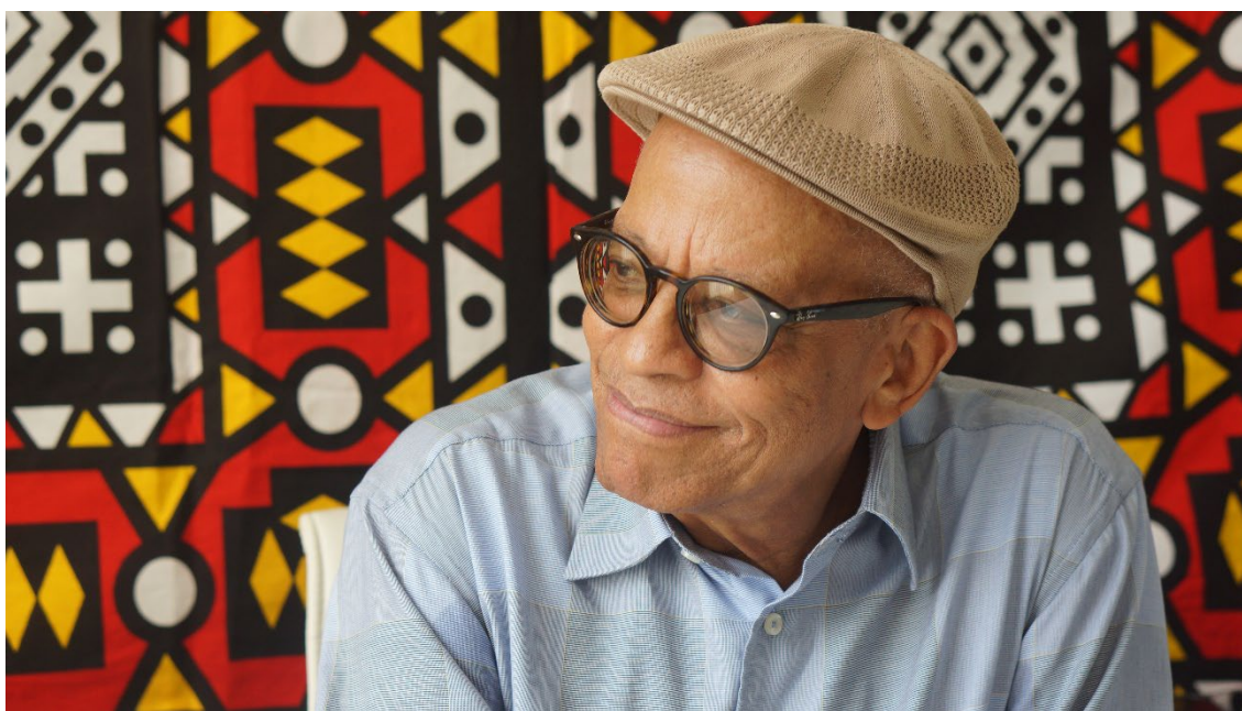
Nei Lopes – escritor e compositor

Banto (no original, bantu) é a designação étnico-linguística de um grande conjunto de povos africanos. Localizados, após migrações seculares, em grande parte do território africano, no centro, no centro-oeste e até no extremo sul, esses povos foram massivamente atingidos pelo tráfico negreiro, do século 16 ao 19. Assim, eles teriam se tornado quase a metade dos africanos escravizados nas Américas, o que parece demonstrar a imensidão de palavras originárias de falares desses povos correntes até hoje, principalmente no português do Brasil. Este fenômeno inclui também denominações de diversos estilos de música e dança praticados na América Latina, que integram o grande painel musical global, como, por exemplo, "samba", "rumba", "merengue" etc.